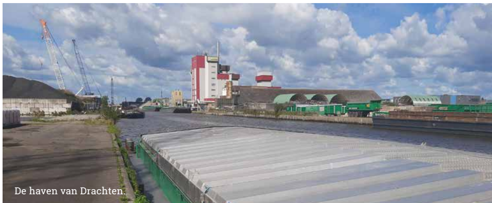
De haven van Drachten.