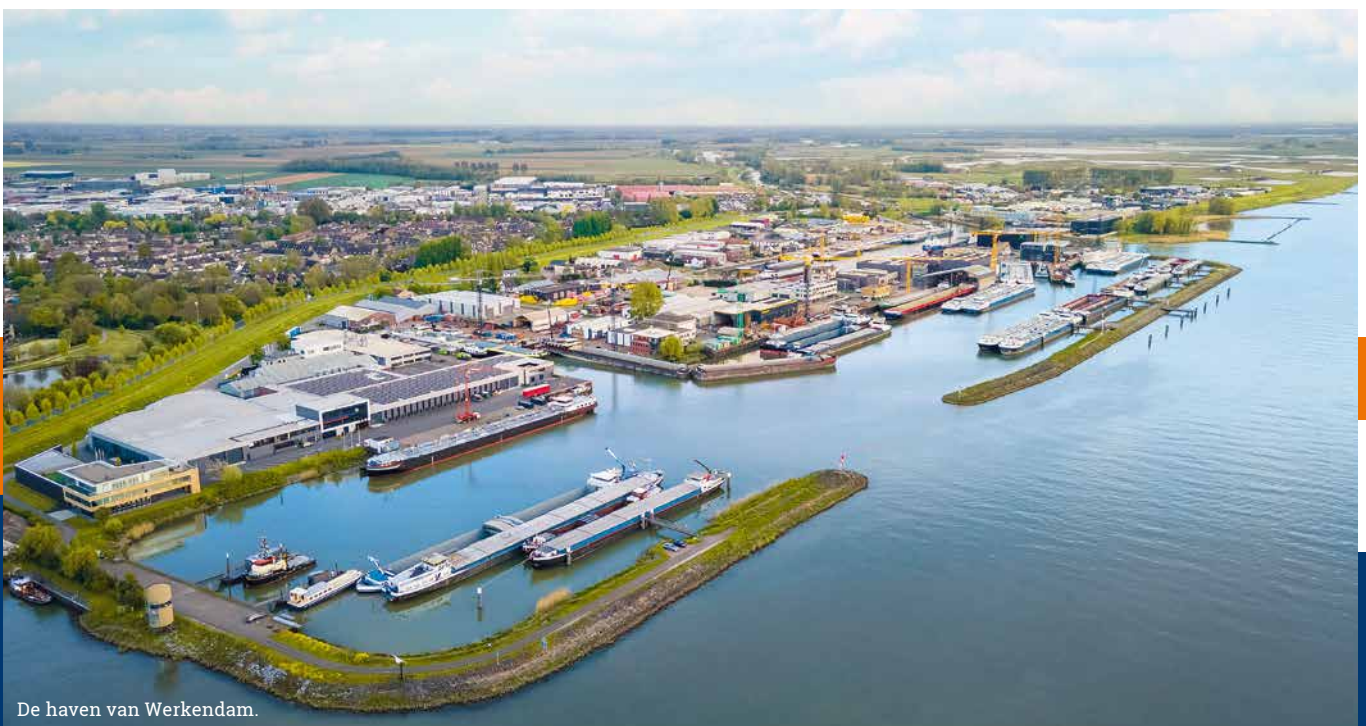
De haven van Werkendam.

"Als Werkendam waren wij de eerste afnemer van ShipLogic. Wij zijn heel enthousiast. Het systeem is zeer gebruikersvriendelijk en het team achter ShipLogic biedt goede ondersteuning. Met inmiddels vijftien aangesloten havens ontwikkelt het systeem zich bovendien steeds verder. Daar profiteren ook wij van!"